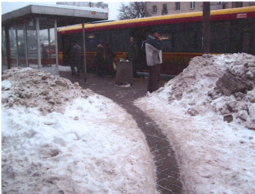
Wąskie przejście do przystanku autobusowego Goraszewska

W Imieniu Osób Niepełnosprawnych i słabszych;